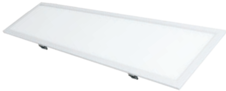
נתונים טכניים 300x1200mm - טכנולוגיית BACKLIGHT גוון אור משתנה